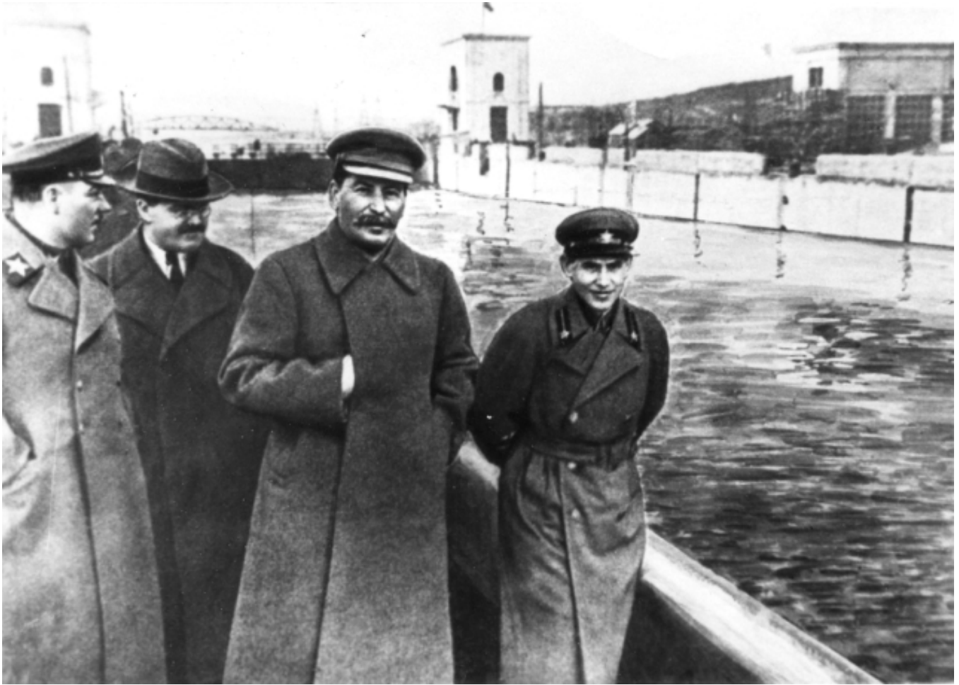
Vorochilov, Molotov, Staline et lejev – ce dernier sera effacé de l'image après sa purge

bas » (les « éléments socialement nuisibles » et « ethniquement suspects ») qui fit huit-cent mille fusillés et plus d'un million de déportés.